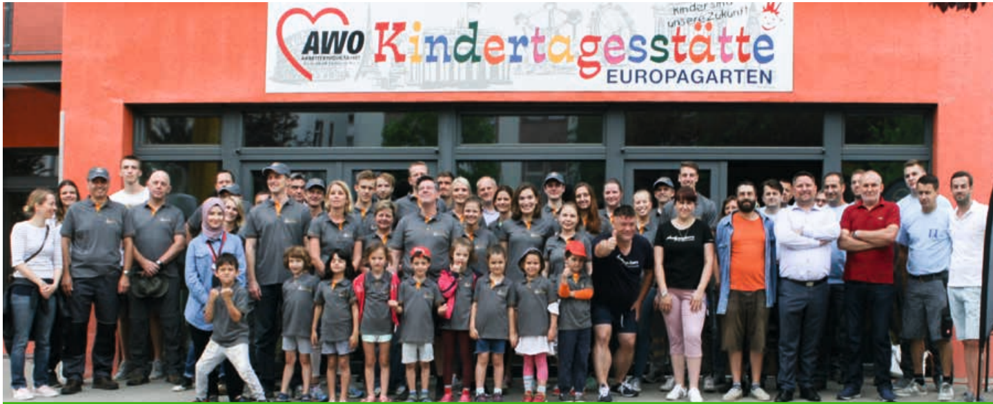
Nahmen Hammer und Pinsel in die Hand: Mitarbeiter der Condor Flugdienst GmbH beim Social Day in der AWO Kita Europagarten.