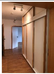
Flur mit Einbauschränke